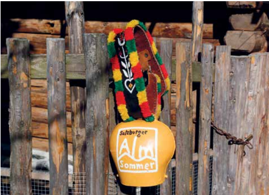
12.06.2022 - Offizielle Eröffnung des Salzburger Almsommers auf der Postalm