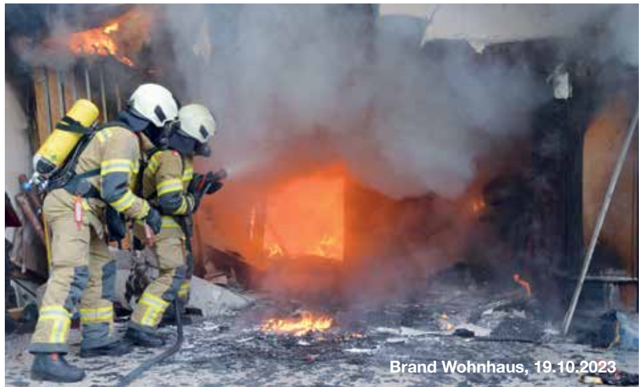
Brand Wohnhaus, 19.10.2023