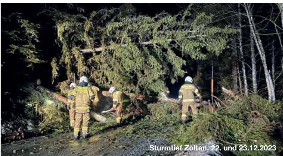
Sturmtief Zoltan, 22. und 23.12.2023