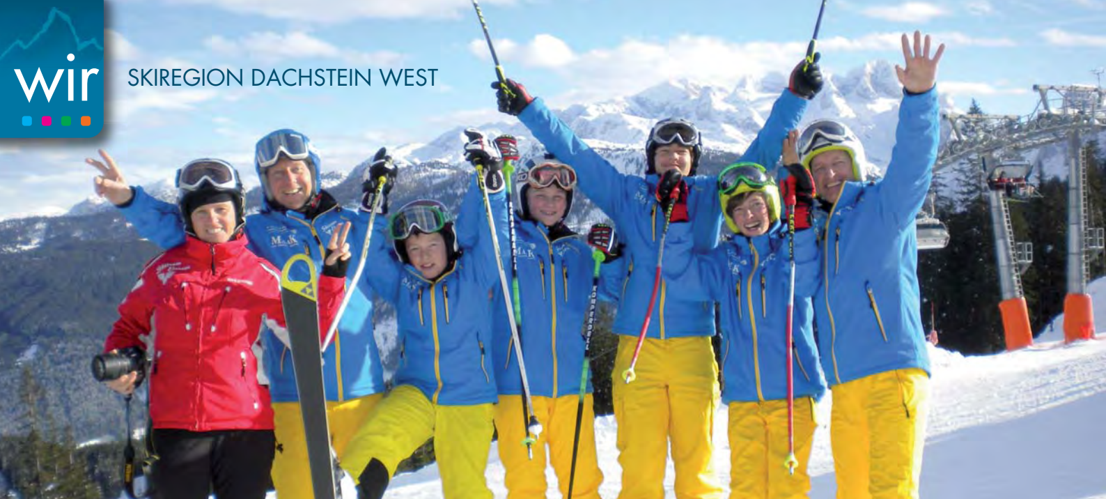
Pistengaudi in der Skiregion Dachstein West