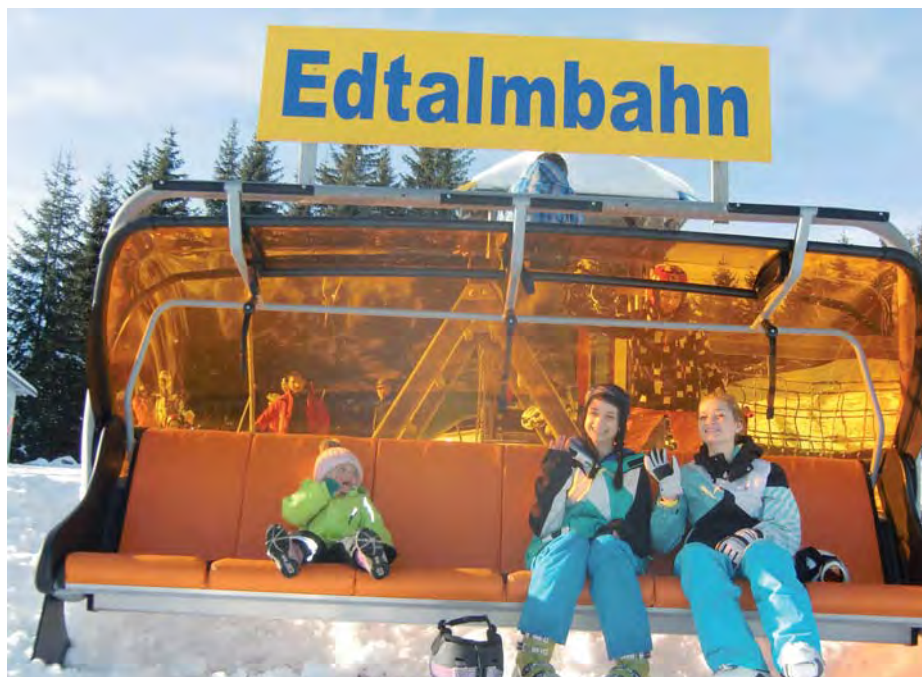
Auch die Kleinen und Jugendlichen fahren auf die Skiregion Dachstein West ab.