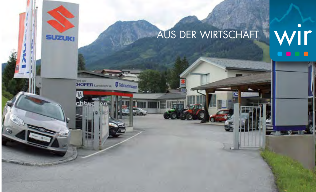
Das Betriebsgelände im Zentrum von Abtenau

Priorität bei Schnitzhofer haben auch starke Marken. Neben den Automarken Ford, Suzuki und SsangYong ist man seit Kurzem auch offizieller Partner für Opel PKW und Nutzfahrzeuge.