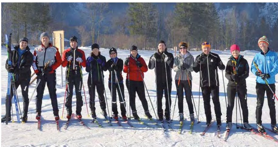
Eltertraining am 27. Dezember 2012 in der Au

Im Nordic Team Abtenau sind derzeit 50 Kinder, welche von dem Trainerteam bestens betreut werden. Dank früher Schneelage konnte bereits Mitte Dezember mit dem Schneetraining begonnen werden.