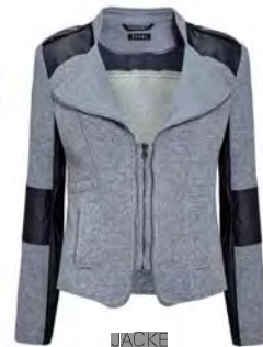
JACKE 229,90 EURO