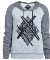
POLOI 129 EURO

Der Event findet am 24. Oktober von 16:00 bis 20:00 Uhr im Jones Store Abtenau statt.