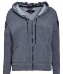
WESTE 159,90 EURO