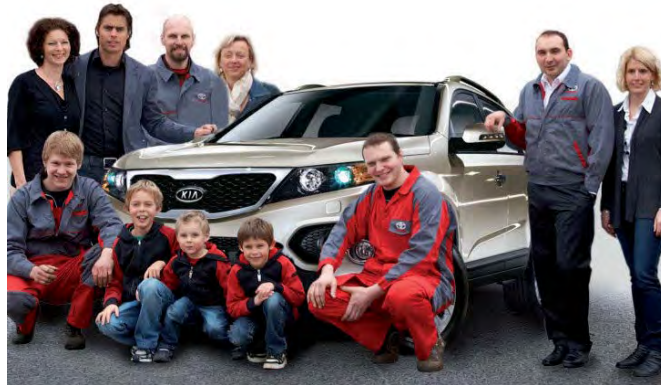
Das Autohaus Aigner Team - kompetent, persönlich und individuell. Ihr Autohaus direkt an der Bundesstraße.

Na dann, auf zum Autohaus Aigner - das gesamte Team freut sich auf Ihren Besuch. Es zahlt sich auf jeden Fall aus.