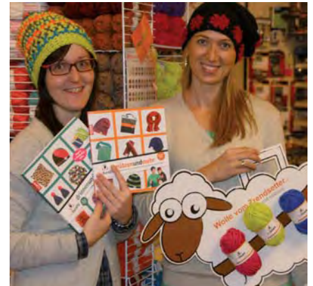
Die Mitarbeiter von Skribo Bachler häkelten bereits „ihre Boshi“ und geben ihnen nützliche Tipps und Tricks.

MI 30.10. u. MI 6.11. Hauben Häkeln MI 13.11. u. MO 18.11. Patschen Filzen MI 20.11. u. MO 25.11. Hauben Häkeln Anmeldung bei SKRIBO BACHLER.