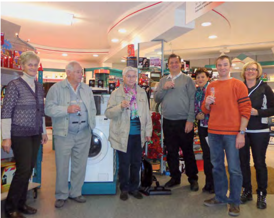
Gewinner des Gewinnspiels.

Auch in Zukunft freuen wir uns, mit professioneller Beratung, fachlichem Know-How und jahrzehntelanger Erfahrung für unsere Kunden da zu sein, hochwertige Produkte in den Bereichen Elektrohandel, Elektrotechnik und Informationstechnik anbieten zu können und für Ihre individuellen Kundenwünsche der ideale Ansprechpartner zu sein! PR