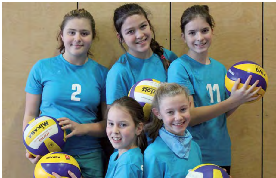
Die jungen Volleyball-Ladies von der Sportunion Abtenau.