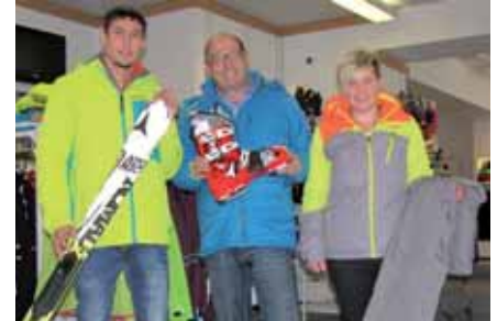
Das Team von Intersport Schwaighofer ist Ihr Spezialist für einen fantastischen Winter!