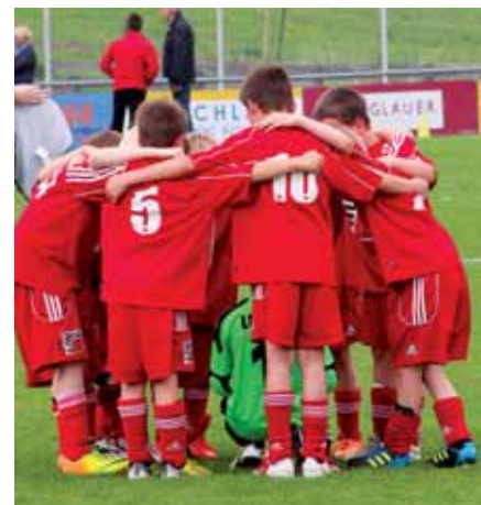
Gemeinschaften für das Leben bilden, die Sportunion Abtenau fördert die sportlichen und sozialen Kompetenzen der Kinder- und Jugendlichen.

Nach dem Vortrag wurde dann noch intensiv über „Sport und die Wirtschaftswelt“ diskutiert. Die TeilnehmerInnen, insbesondere die Sponsoren, sehen solche Impulse wie das Sportforum der Sportunion Abtenau sehr positiv und hoffen auch in Zukunft auf ähnliche Veranstaltungen.