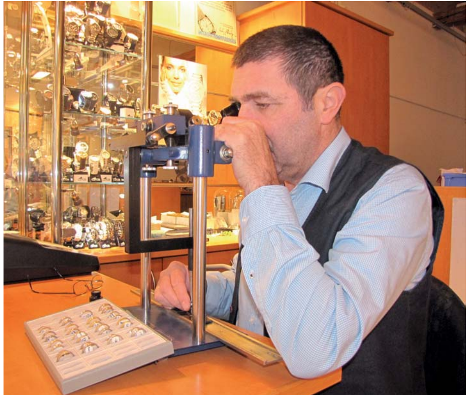
Bei uns werden Ihre Ringe mit einer kostenlosen, persönlichen Gravur versehen.

Ein Heiratsantrag mit einem funkelnden Verlobungsring ist ein gelungener Auftakt für den Schritt vor den Traualtar.