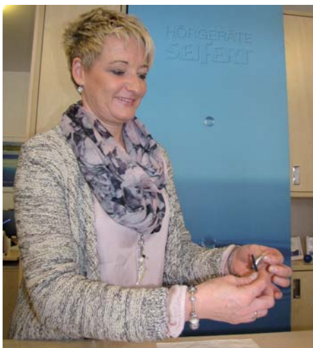
Hörgeräte Seifert kümmert sich auch um Wartung und Pflege ihres Hörgeräts