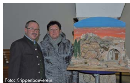
Der Krippenbauverein bedankt sich recht herzlich bei der Bevölkerung für den zahlreichen Besuch.