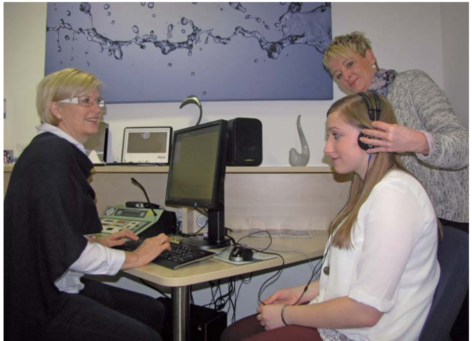
Einfach gut hören: Das Team von Hörgeräte Seifert bietet Ihnen einen kostenlosen Hörtest