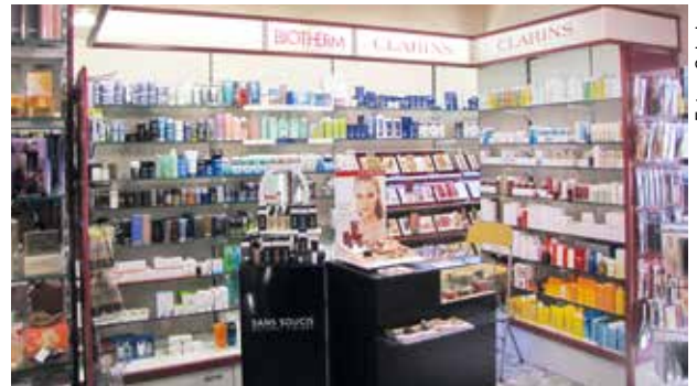
Die „Gewusst wie“ Drogerie hat alles für's individuelle Wohlbefinden