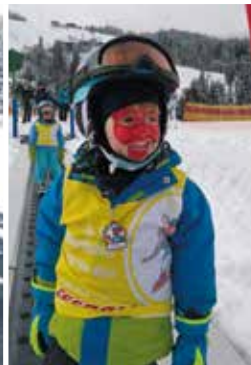
Fotos von oben nach unten: Berghutmen Dachstein-West, Schober, Skischule freeride alpin