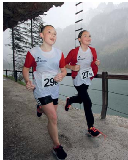
Wachselnass, aber motiviert: Kinder aus Abtenau im Regen