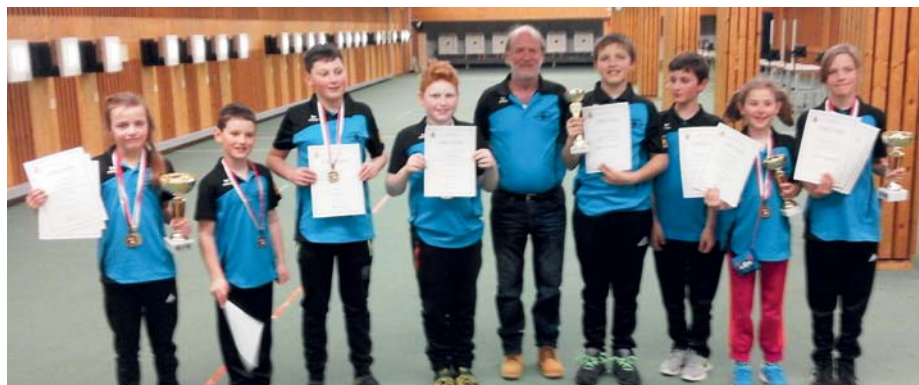
Alle neun Jungschützen bei der Landesmeisterschaft in Rif.

Ab Mitte Mai begann wieder die KK-Saison im Schützenhaus, es wird jeden Freitag ab 16.00 Uhr geschossen. Jeder kann mitmachen, es kann stehend, stehend aufgelegt und sitzend aufgelegt geschossen werden.