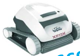
Aqua Robot xeoX light