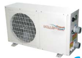
Wärmepumpe ECO 3