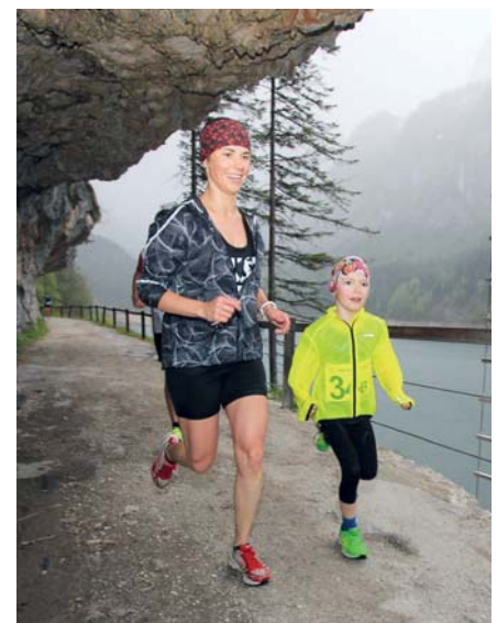
In Begleitung liefen auch schon die Kleinsten mit