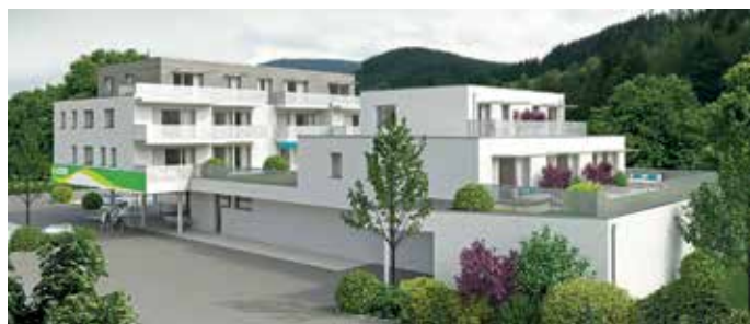
Miet- und Eigentumswohnungen in zentraler Lage in Annaberg

Ein modernes Wohnprojekt wird bis Ende dieses Jahres in Annaberg mit 15 attraktiven Miet- sowie Eigentumswohnungen und einem Nahversorger im Erdgeschoß realisiert. Die sonnigen Wohnungen mit Größen zwischen 52 m 2 und 88 m 2 bieten einen wunderschönen Ausblick auf die Berge. Die Wohnanlage punktet mit großzügigen Dachterrassen, Loggien und Balkonen, zum Teil eigenen Gartenanteilen, lichtdurchfluteten Räumen mit Fußbodenheizung und einem umweltfreundlichen Energiesystem. Ein weiterer Vorteil ist die sehr gute Infrastruktur mit Kindergarten, Volks- und Neue Mittelschule, Einkaufsmöglichkeiten und Bushaltestelle in unmittelbarer Nähe. Die Fertigstellung ist für Ende 2017 geplant.