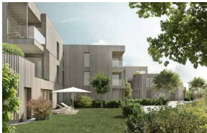
Visualisierungen (2): Peter Kröll

Hier sind derzeit drei 4-Zimmer-Eigentumswohnungen zu haben. Darunter ist auch eine 85 m 2 -Wohnung um 125.000,- Euro inkl. Tiefgaragenplatz.