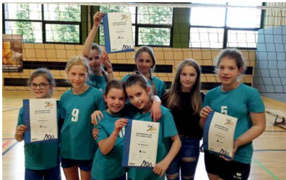
Unsere U11 Mädels haben sich letzte Saison für das Landesfinale qualifiziert und erreichten dort den 5. und 8. Platz! Herzliche Gratulation!

Alle Kontakte und Infos sind auf unsere Homepage www.sportunion-abtenau.at oder auf Facebook: Sportunion Abtenau AktiviSport zu finden. Auch auf Instagram ( su_abtenau_aktivsport ) kann man uns seit ein paar Monaten folgen.