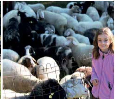
Bericht und Fotos: Elisabeth Grill