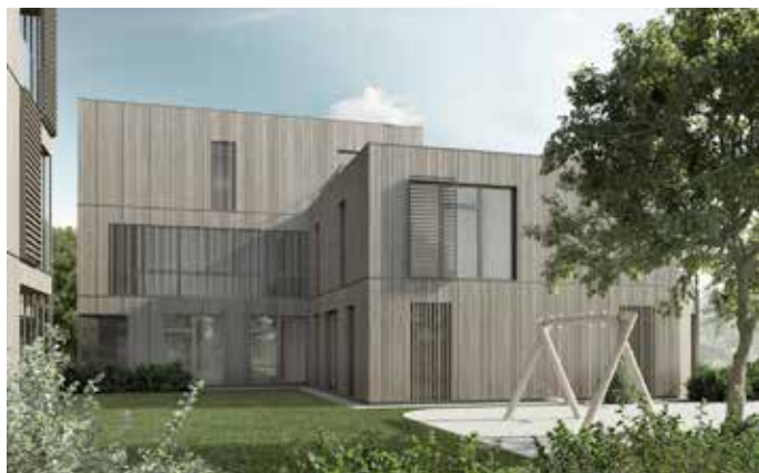
Ansprechende Architektur in Kuchl - Markt 166

Vier Eigentumswohnungen sind aktuell noch verfügbar. Eine Wohnbauförderung von bis zu 29.200,- Euro ist beispielsweise bei einer 3-Zimmer-Wohnung mit 80 m 2 zum Preis von 371.500,- Euro (inkl. 2 Tiefgaragenplätze) möglich.