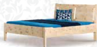
„Dachstein“ Aktionspreis € 2.785,-