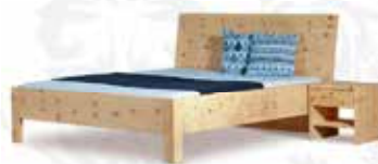
„Gosaukamm“ metallfrei Aktionspreis € 2.169,-