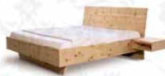
„Gipfelrast“ Aktionspreis € 2.277,-