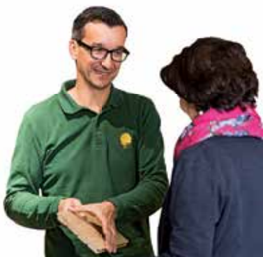
Beste Beratung bei WIHO Wimmer Holz

Wimmer Holz 5431 Kuchl, direkt an der Bundesstraße Tel. +43 (0) 6244-7348-0 www.WIHO.at