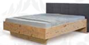
„Bergsommer“ Aktionspreis € 2.240,-