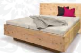
„Bergwiese“ Aktionspreis € 1.790,-