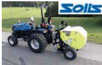
Traktor mit Servolenkung ab € 10.600,00