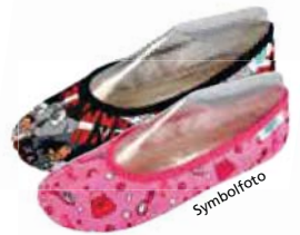
GYMNASTIKSLIPPER MÄDCHEN U. BURSCHE von Gr. 24 – 40