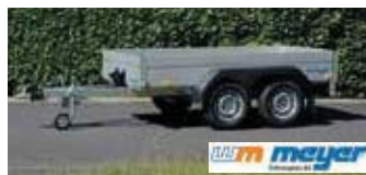
Tandemanhänger 2510 x 1250 mm € 1.770,00