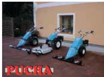
Motormäher € 3.200,00