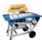
Tischwippsäge € 1.540,00