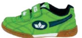
HALLENTURNER KINDER UND JUGEND von Gr. 31 – 40