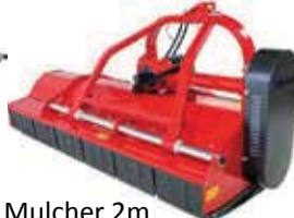
Mulcher 2m € 3.200,00