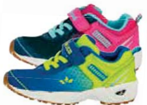
KINDER TRAININGSSCHUH von Gr. 27 – 38