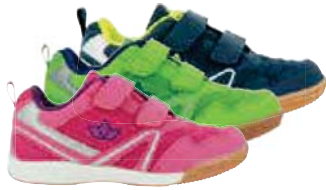
HALLENTURNER MÄDCHEN U. BURSCHE von Gr. 29 – 40