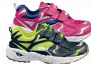
KINDER TRAININGSSCHUH von Gr. 27 – 38