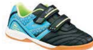
HALLENTURNER BURSCHE von Gr. 31 – 40