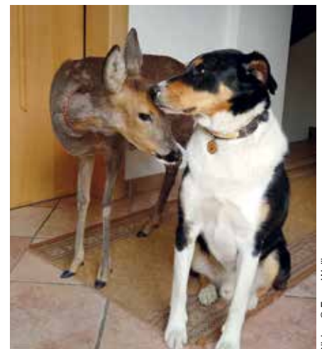
Fipsi und Nero