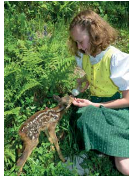
Bambi ganz klein