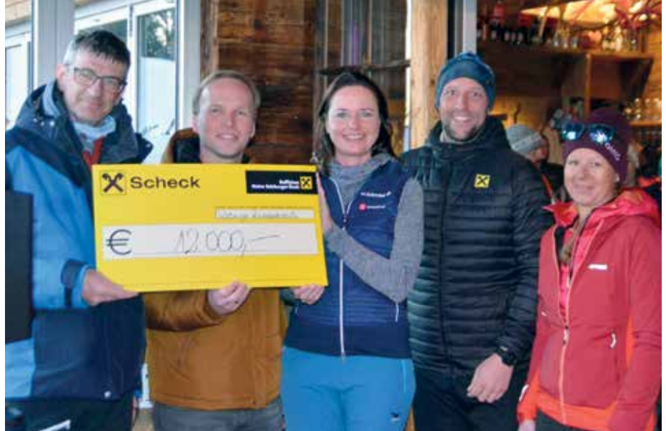
12.000 Euro für die Salzburger Kinderkrebshilfe gesammelt

Neben der karitativen Spende an die Salzburger Kinderkrebshilfe wird ein Teil der Gesamtspendensumme dafür verwendet, Bäume in der Region zu pflanzen, die das Klima positiv beeinflussen sollen. „Uns ist es ein besonderes Anliegen, uns für Projekte für mehr Nachhaltigkeit in unserer Region einzusetzen. Mit dem gesammelten Geld in Höhe von 2 500 Euro können wir einen wichtigen Beitrag für den Umweltschutz unserer Skiregion leisten,“ erklärt Schiefer. Auch an die Ukraine wurde vor Ort gedacht: Teilnehmer und Zuschauer durften sich für eine freiwillige Spende für Ukraine-Flüchtlinge einen Musikwunsch aussuchen. Damit konnten zusätzlich noch über 500 Euro gesammelt werden.