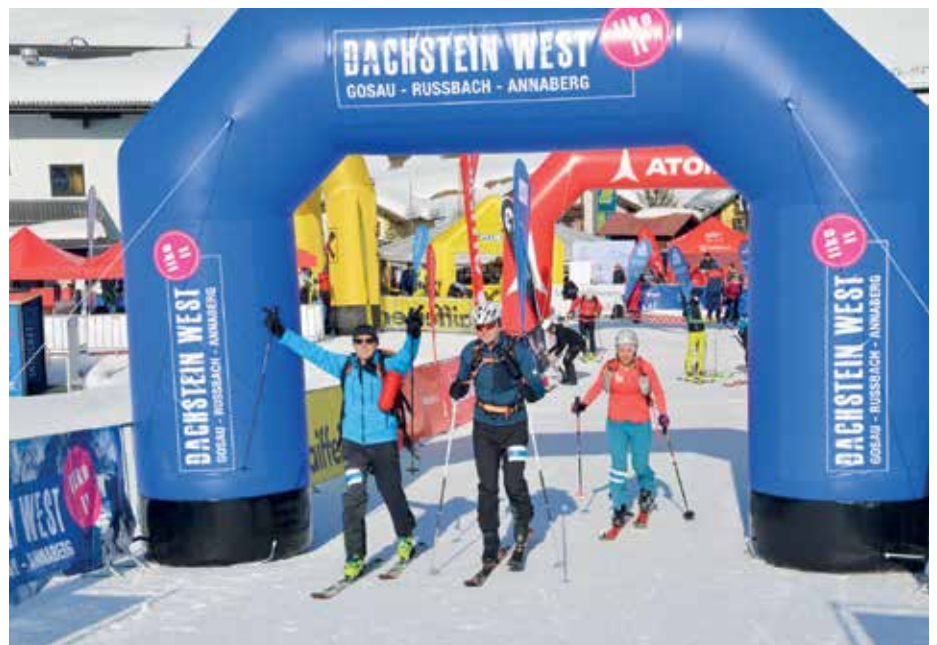
430 Tourenger waren mit dabei