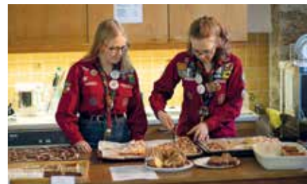
Reißender Absatz am Kuchenbuffet

schen Studentinnen an die Grenze ihrer Heimat transportiert wird, um ihre Landsleute zu unterstützen. Gehandelt und gefeilscht wurde von 09:00 – 16:00 Uhr und so mancher interessierte Besucher fand das Schnäppchen, auf das er gehofft hatte.