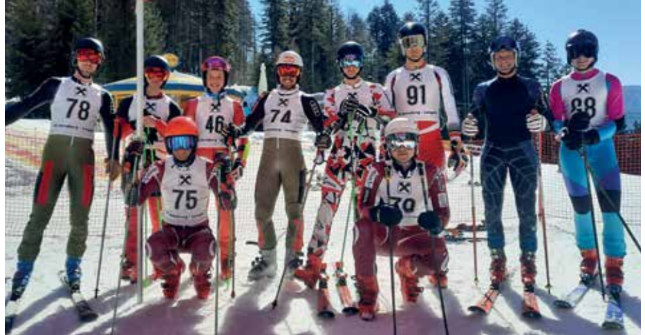
Die besten 10 Herren vor dem Start