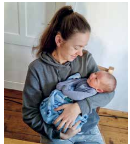
Unser erstes ukrainisches Baby. Es wurde hier geboren und lebt in Rußbach.

Bitte meldet euch, der Hilfsbedarf ist groß und wir können nur Flüchtlingsfamilien aufnehmen, wenn der Wohnraum gesichert ist.