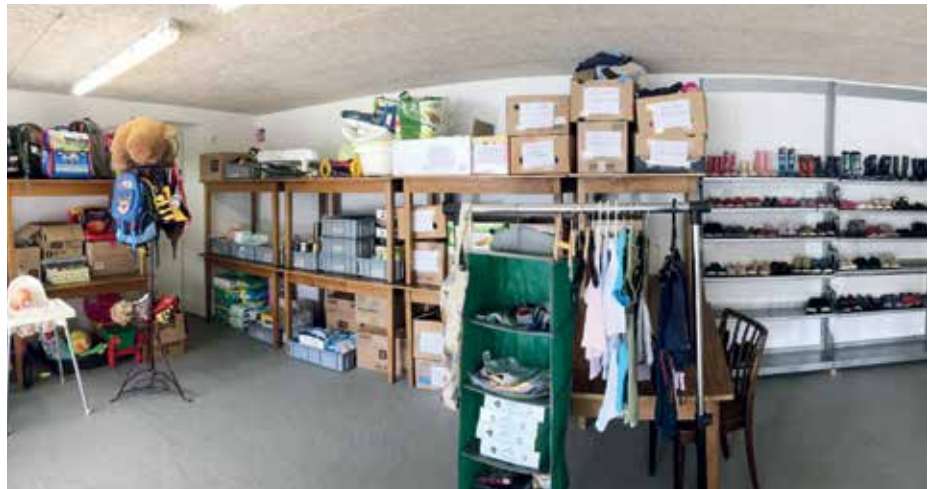
Unser „Sachspendenshop“ zur freien Entnahme in Rußbach, fein säuberlich sortiert und geordnet.

ÜBER ERGEBNISSE WERDEN WIR REGELMÄSSIG IN UNSERER WEBSITE (www.lammertal-hilft.at) INFORMIEREN.