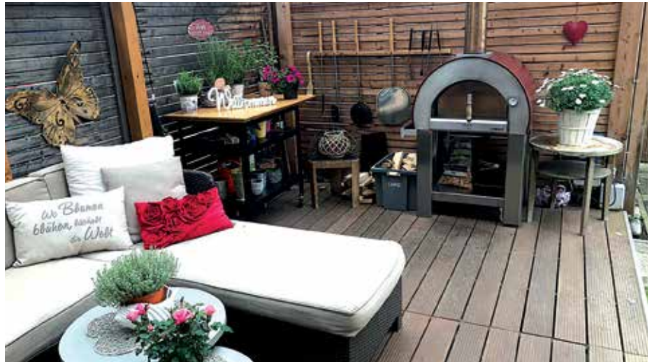
Gestalten Sie Ihren eigenen, persönlichen Outdoorbereich

Das Angebot an Terrassenböden geht von Lärche über Thermoese, Thermokiefer,