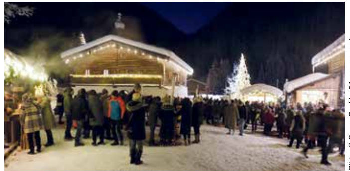
Eindruck von der Stimmungsvoll gestalteten Weihnachtsroas