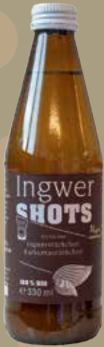
Ingwer SHOTS Erfrischende Immun Booster EUR 9.90 (330 ml) EUR 2.49 (60 ml) gesehen bei Naturladen Bhanu