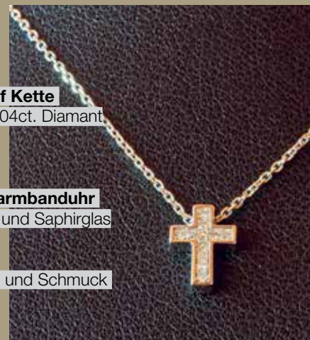
8-eckige Damenarmbanduhr mit Schmuckband und Saphirglas Yves de Bur EUR 789,- gesehen bei Uhren und Schmuck Schützinger