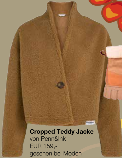
Cropped Teddy Jacke von Penn&Ink EUR 159,- gesehen bei Moden Quehenberger