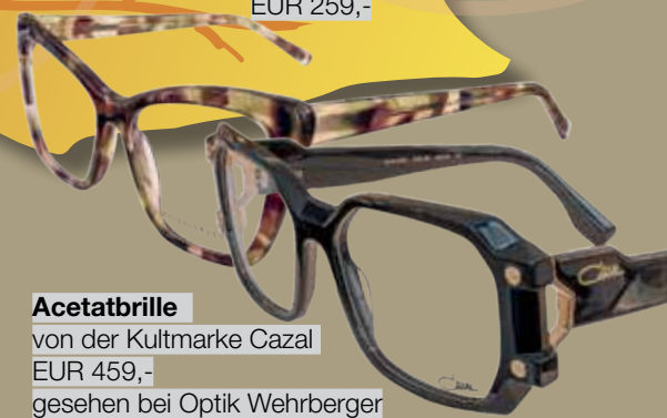
Acetatbrille von der Kultmarke Cazal EUR 459,- gesehen bei Optik Wehrberger