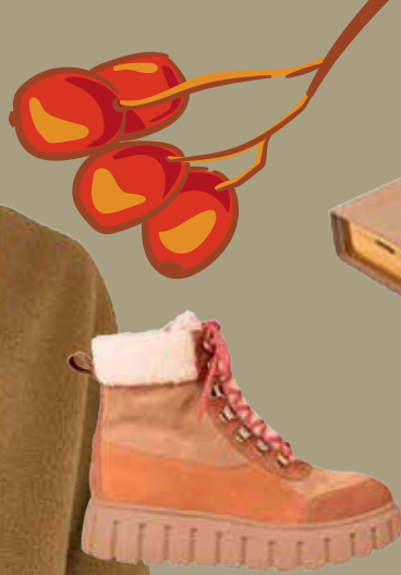
Schnürer von KMB Shoes EUR 149,-