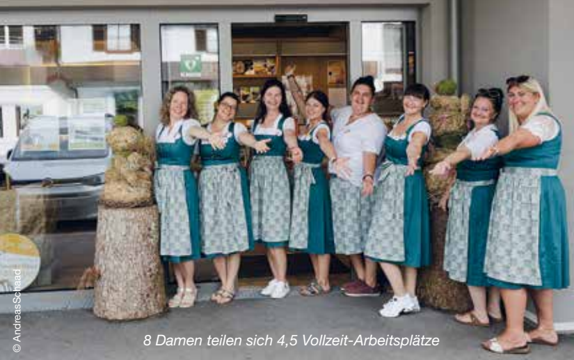
8 Damen teilen sich 4,5 Vollzeit-Arbeitsplätze